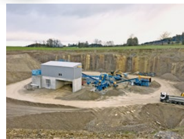
Kieswerk «Stöcklen» Arnegg