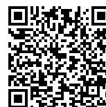
Formular für Aushubdeklaration

Massgebend für die Klassifizierung von Aushub- und Mischabbruchmaterial ist die Verordnung über die Vermeidung und die Entsorgung von Abfällen (Abfallverordnung, VVEA).